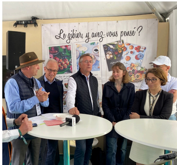
Table ronde sur le thème de la venaison organisée sur le stand d'InterProchasse

Parmi les nombreuses actions en faveur de la filière « Chasse », InterProchasse a organisé deux tables rondes : une sur le thème de la venaison et l'autre sur le dossier scientifique de la caille des blés.