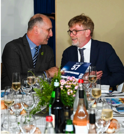
Table d'InterProchasse au dîner de gala du Game Fair, en présence de Marc Fesneau, le ministre de l'Agriculture et de la Souveraineté Alimentaire.

Enfin, à l'occasion du dîner de gala du Game Fair le samedi soir, InterProchasse était très honorée de réunir à sa table le ministre de l'Agriculture et de la Souveraineté Alimentaire, Marc FESNEAU, ainsi que des acteurs du monde de la chasse française, le tout autour du thème des principaux enjeux économiques de la filière.