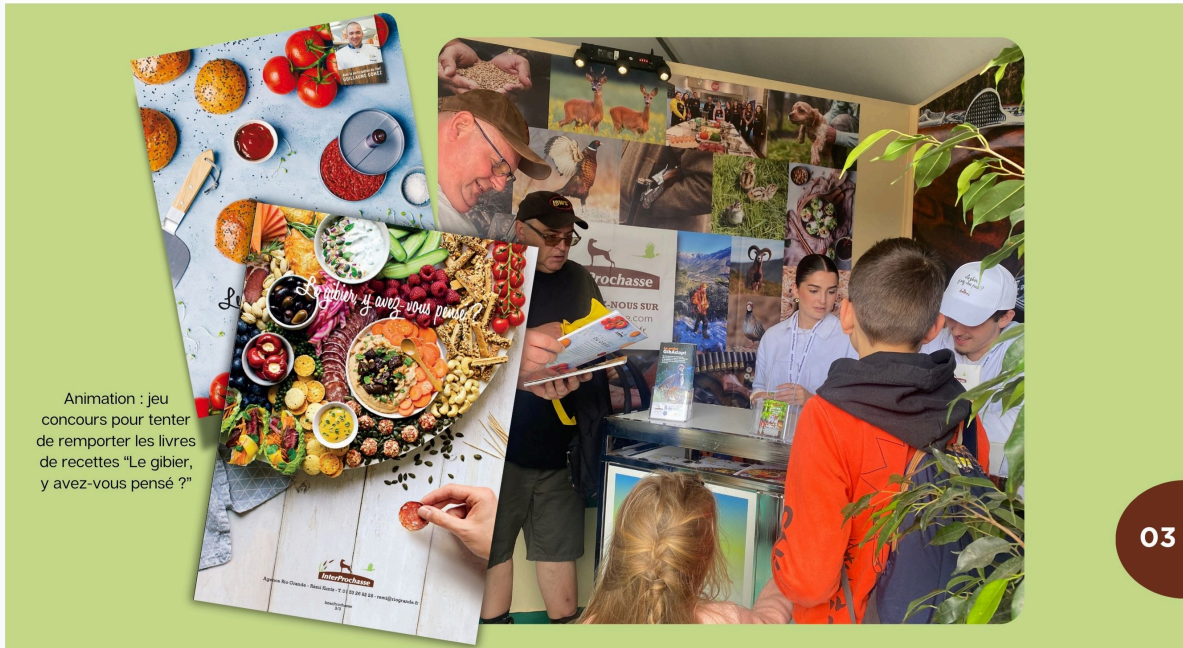
Animation : jeu concours pour tenter de remporter les livres de recettes "Le gibier, y avez-vous pensé ?"

Le jeu-concours d'InterProchasse, distribué à tous les visiteurs à l'entrée du salon, a une nouvelle fois rencontré un vif succès. De nombreux participants sont venus retirer les livres de recettes « Le gibier, y avez-vous pensé ? » édités par InterProchasse. Cela a permis de créer un lien entre le grand public et les représentants de la filière « Gibier » et d'échanger sur ce thème fédérateur.